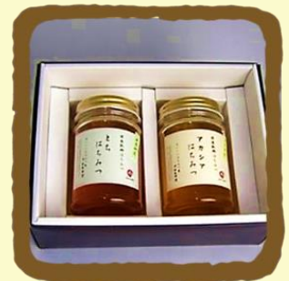
はちみつギフト B セット