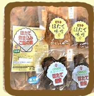
ほたて加工品セレクト