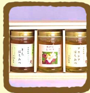
はちみつギフト A セット