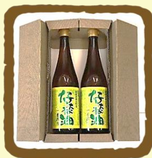
横浜町産菜種油 660g × 2本