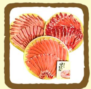
あおりほろよいとん 豚すき焼き用三点盛り

※ 農産物・水産物につきましては、収穫時期によって用意が難しい場合がございますのでご了承ください。