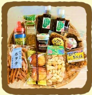
はこいりよこはま セレクト A

ここでは、ふるさと納税サイト「さとふる」に掲載されているお礼品や横浜町の特産品の一部をご紹介します。