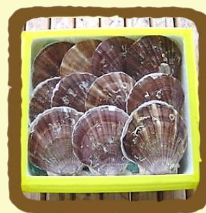
陸奥湾横浜町活ほたて