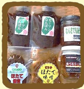
ごはんの友セレクト