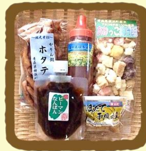
はこいりよこはま セレクト C