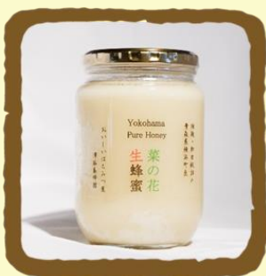
菜の花生はちみつ