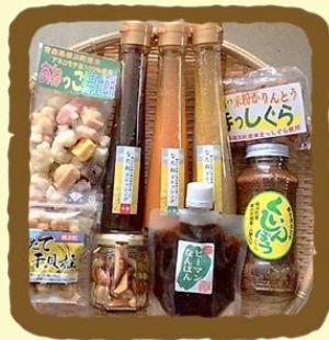
はこいりよこはま セレクト B