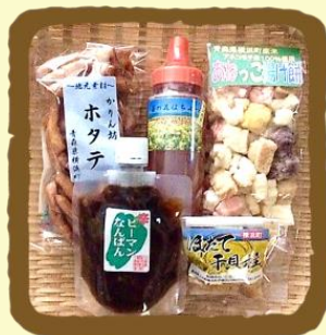
はこいりよこはまセレクト C