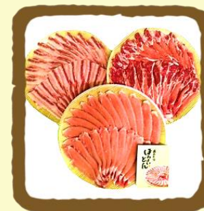
あおりほろよいとん 豚すき焼き用三点盛り