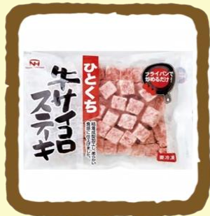
ひとくち牛サイコロステーキ セット 500g × 5 パック