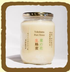
菜の花生はちみつ