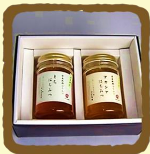
はちみつギフト B セット