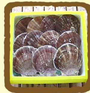
陸奥湾横浜町活ほたて 2kg ・ 4kg