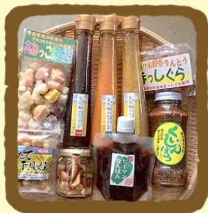
はこいりよこはまセレクト B