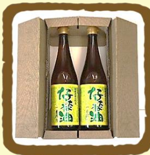
横浜町産菜種油 660g × 2 本