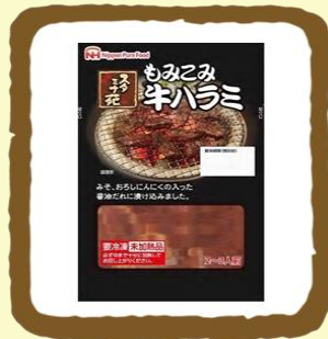
スタミナ苑もみこみ牛ハラミ セット 200g × 10 パック