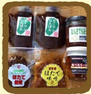
ごはんの友セレクト