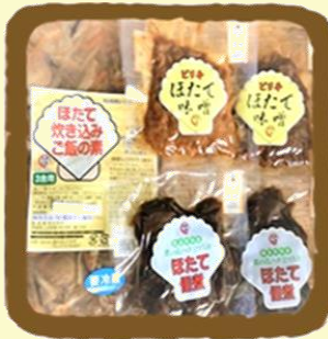
ほたて加工品セレクト