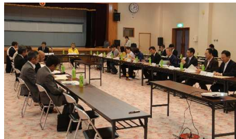
事業推進協議会の様子 ▶

第1回道の駅よこはまエリア事業推進協議会を、平成28年5月30日（月）に横浜町ふれあいセンターにて開催しました。協議会では事務局より協議会の設置目的や今年度の取り組みについて説明し、意見交換を行いました。