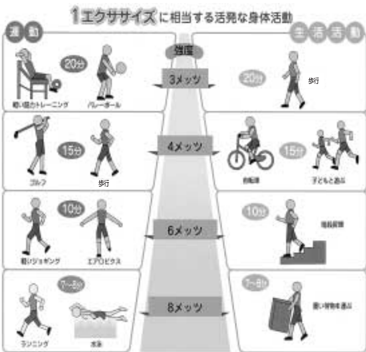
例) 身体活動量の目安