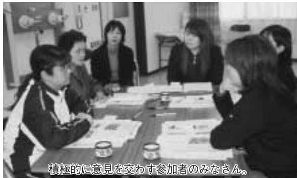
積極的に意見を交わす参加者のみなさん。

まとめでは「特に朝食については、良好な食生活には生活リズムが大切。早寝早起きが基本であり、食事の30分前