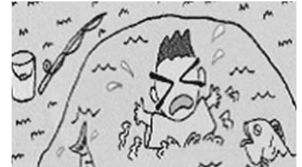
水難救助訓練の状況