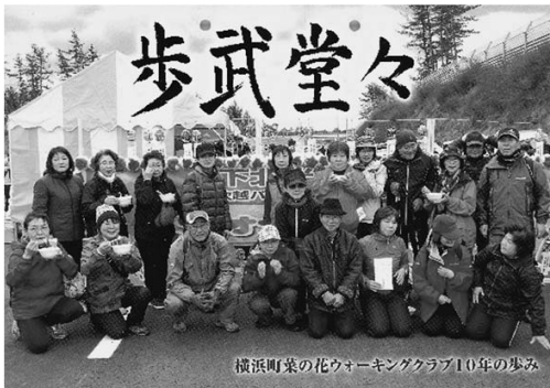
横浜町菜の花ウォーキングクラブ10年の集み