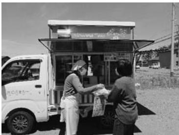
キッチンカー食育PR