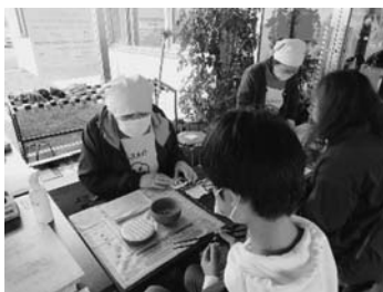
公民館まつり食育PR