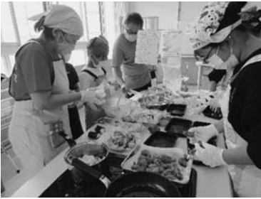
小学6年生料理教室