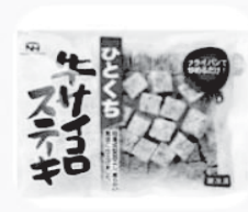
サイコロステーキ