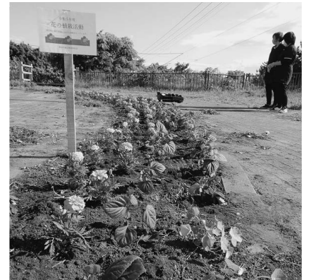
6月5日(月) 菜の花プラザ