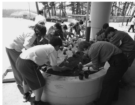
6月8日(木) 横浜中学校