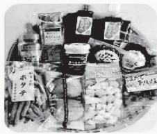
よこはまセレクト