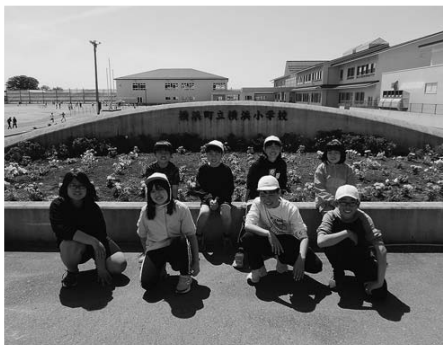
5月25日(木) 横浜小学校

それぞれの花壇等には、サルビア、ベチュニア、インパチュンス、マリーゴールドといった様々な種類の花が植え付けられ、色彩豊かな花壇等になりました。町の緑化推進活動として、来年度も継続して花の植栽活動を実施する予定です。