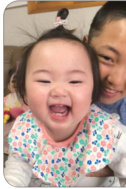
敬寿・美佳さんの子 女の子（松栄）

パンダのぬいぐるみとねえねとにいが大好きなあおちゃん 「元気ですくすく大きくなあれ♡」