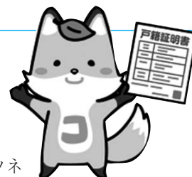
法務省 コセキツネ

（注意）戸籍個人事項証明書、電算化されていない戸籍、戸籍の附票など、上記以外の戸籍証明書については、これまで通り本籍地のみでの発行となります。