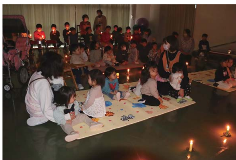
12/25 ちどり保育園クリスマス会