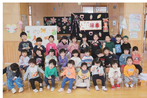
1/6 第二ちどり保育園新年お楽しみ会