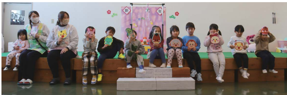
1/9 ちどり保育園 新年会