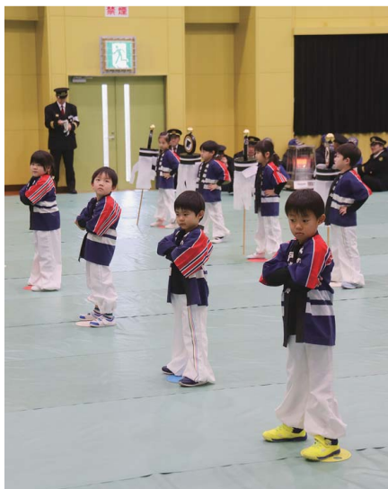
1/7 横浜町消防出初式 ちどり保育園幼年消防クラブ