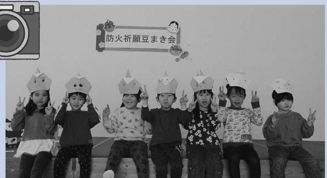
2/3 ちどり保育園 防火祈願豆まき会